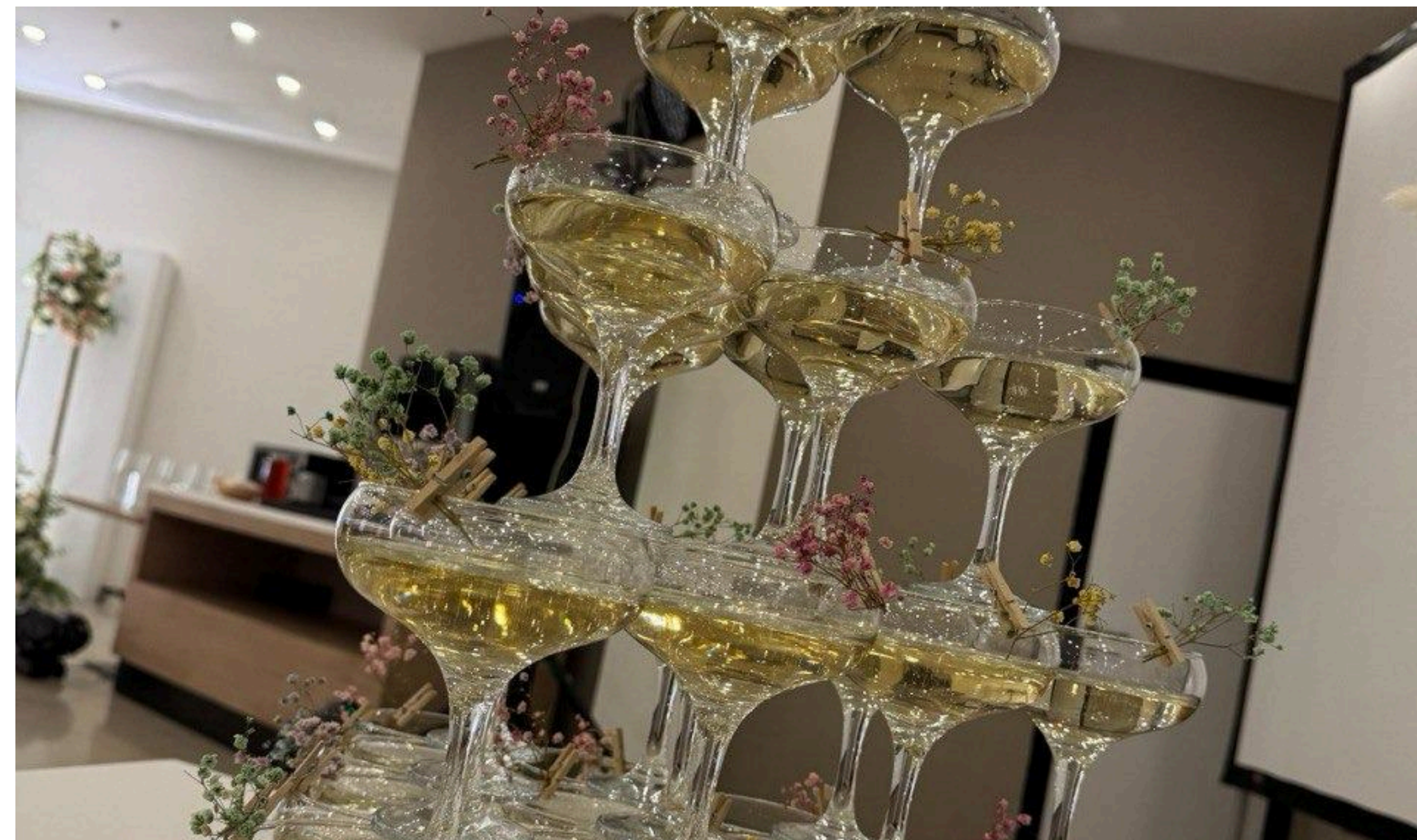
Пирамида из шампанского изящное и зрелищное украшение вечера