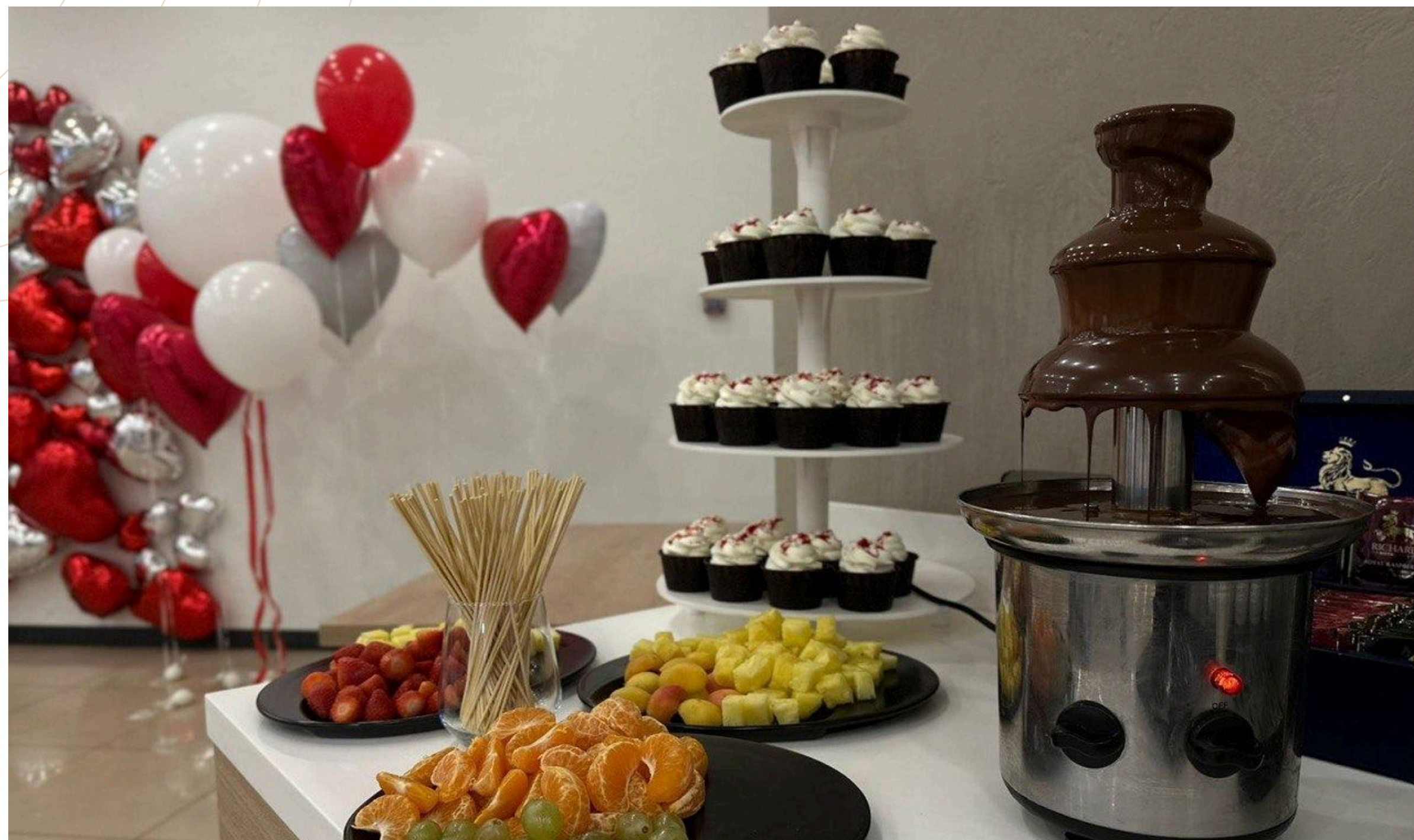
Шоколадный фонтан и фрукты на шпажках украсят любое торжество